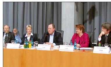
v.l.n.r.: Wolfgang Thierse, Petra Merkel, Peer Steinbrück, Mechthild Rawert, Swen Schulz

Die Landesgruppe der Berliner SPD-Bundestagsabgeordneten hat Peer Steinbrück am 5. Oktober 2010 eingeladen, um mit Bürgerinnen und Bürgern über die Finanzkrise, die Ursachen und die Folgen zu sprechen. In seiner Rede schilderte er seine Unzufriedenheit über den Umgang mit der Krise bei den seit 1999 abgehaltenen G20-Gipfeln der wichtigsten Industrie- und Schwellenländer. Die Staats- und Regierungschefs der G20-Staaten haben bisher umfangreiche Einsparziele zu Lasten der Bürgerinnen und Bürger vereinbart, aber sie verschonen weiterhin die eigentlichen Verursacher der Krise aus der Finanzindustrie.